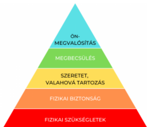
Az MKK Maslow elvei szerinti szükségletpiramisa

A Kar közreműködik a kormánytisztviselők foglalkoztatását, hivatásgyakorlását és munkavégzését befolyásoló jogszabályok megalkotásában, módosításában (munkaidő, pihenőidő, illetmény, jutalmazás, juttatások), véleményezi a szakmai vizsgákkal kapcsolatos előírásokat, sőt a Közigazgatási Továbbképzési Kollégiumba tagot is delegál. Amellett, hogy részt vesz a Közszolgálati Érdekegyeztető Fórum ülésein, a hasonló elvek mentén szerveződő Magyar Rendvédelmi Karral is rendszeres kapcsolatot ápol. A Nemzeti Közszolgálati Egyetemmel aláírt közigazgatási szakmai együttműködési megállapodás célja pedig az integritási értékek közszolgálatban történő erősítésén túl a kormánytisztviselők szakmai munkájának támogatása, valamint a közigazgatás presztízsének folyamatos emelésében való közreműködés.